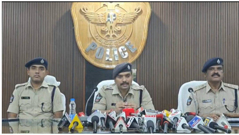
మాచర్ల, పెన్ సత్తా, ఏప్రిల్ 09: సోషల్ మీడియాలో పుర్రడిన పరిచయం కాస్తా ఓ మహిళకు పై దాడి, అత్యాచార యత్నానికి దారితీసిన ఘటన మాచర్ల పట్టణంలో వెలుగుచూసింది. ఈ కేసుకు సంబంధించిన వివరాలను పల్నాడు జిల్లా పోలీస్ యంత్రాంగం గురువారం

తీనివాస్ ఆమె ఇంటికి వచ్చారు. ఆ సమయంలో ఇంట్లో ఎవరూ లేకపోవడంతో, నిందితుడు ఆమె పై అత్యాచారానికి ప్రయత్నించాడు. బాధితురాలు ప్రతిఘటించడంతో ఆగ్రహానికి గురైన నిందితుడు, ఆమెను తీవ్రంగా కొట్టి, కాళ్లు చేతులు కట్టిసి భయ భ్రాంతులకు గురిచేసి అక్కడి