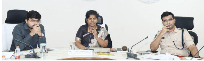
వివరాలను తెలుసుకొని కారణాలను విశ్లేషించారు. రోడ్డు ప్రమాదాలు ఏ కారణం వలన జరుగుతున్నాయో