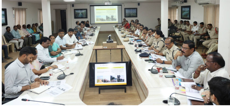
ప్రమాదాల నివారణకు తక్షణ చర్యలు తీసుకోవాలి.