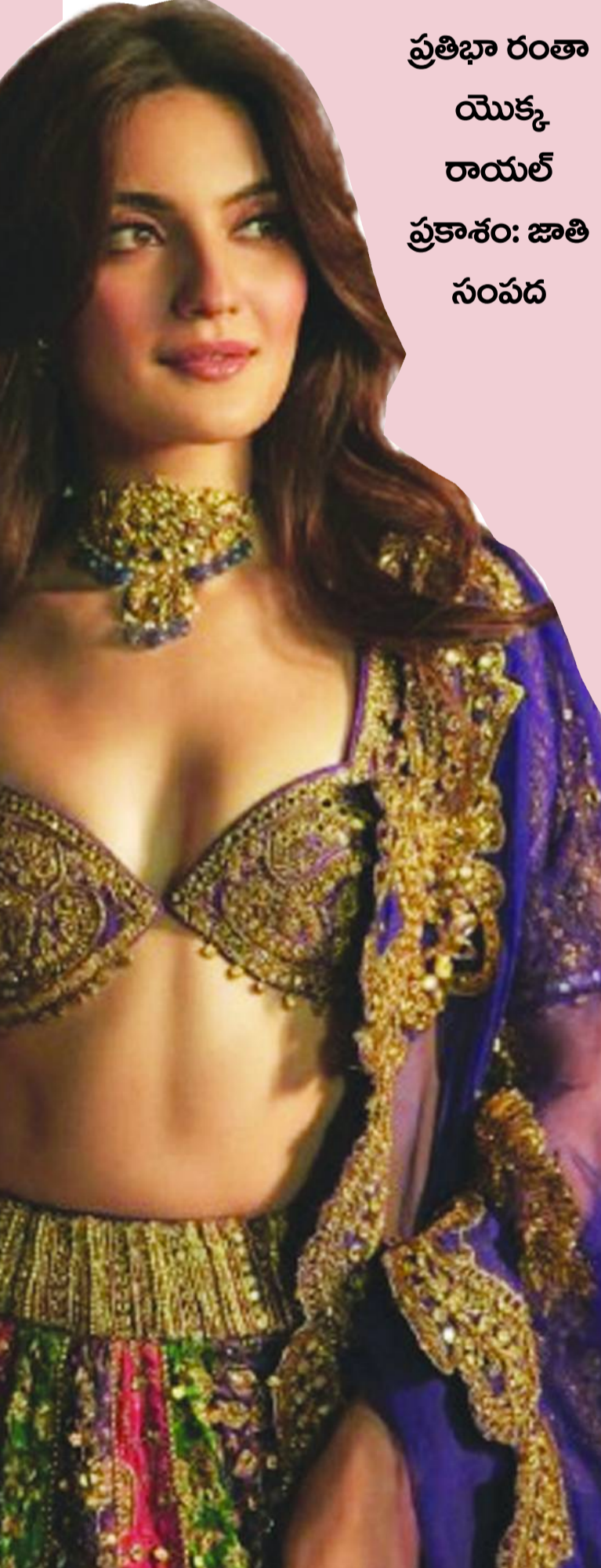
ప్రతిభా రంతా యొక్క రాయల్ ప్రకాశం: జాతి సంపద