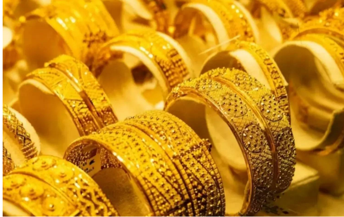
ఫాన్స్ ఉందని నిపుణులు చెబుతున్నారు. అందుకే దీర్ఘకాలిక పెట్టుబడిదారులు ధర తగ్గినప్పుడల్లా కొంచెం కొంచెం కొనుగోలు చేసే బై ఆన్ డిప్ వద్దని పాటించాలని సూచిస్తున్నారు. అయితే

అంతర్జాతీయంగా రాజకీయ అనిశ్చితి నెలకొన్నప్పుడు ఇన్వెస్టర్లు సురక్షితమైన పెట్టుబడిగా భావించే బంగారం వైపు మొగ్గు చూపుతారు. ప్రస్తుతం అమెరికా, ఇరాన్ మధ్య అణచి చర్యలు విఫలం కావడం, హోర్నుల్ జలసంధిని అమెరికా దిగ్బంధించడం వంటి పరిణామాలు ప్రపంచవ్యాప్తంగా చమురు సంక్షోభం భయాలను పెంచాయి. దీని ప్రభావంతో స్టాక్ మార్కెట్లు ఒడిదుడుకులకు లోనవుతుండగా, బంగారం ధరలు మాత్రం రికార్డు స్థాయిలకు చేరుతున్నాయి. నేడు భారతీయ మార్కెట్లో 24 క్యారెట్ల (మేలిమి) బంగారం ధర పది గ్రాములకు రూ.1,52,830 వద్ద పలుకుతోంది. హైదరాబాద్, విజయవాడ, విశాఖపట్నంలో బంగారం ధరలు ఒకే రకంగా ఉన్నాయి. ఇక్కడ 24 క్యారెట్ల 10 గ్రాముల బంగారం ధర రూ.1,52,830 కాగా, ఆభరణాల తయారీకి వాడే 22 క్యారెట్ల బంగారం ధర రూ.1,40,090 కు చేరింది. అంటే దాదాపు లక్షన్నర రూపాయలకు దగ్గరగా పనినీడే రేటు ఉండటంతో పెళ్లిళ్ల సీజన్లో ఉన్న వారు ఆందోళన వ్యక్తం చేస్తున్నారు. చెన్నైలో మాత్రం ధరలు వీటికంటే కాస్త ఎక్కువగా (రూ.1,53,810) ఉన్నాయి. బంగారంతో పోటీ పడుతూ వెండి కూడా భారీగానే పెరుగుతోంది. దేశీయ మార్కెట్లో నేడు కిలో వెండి ధర రూ.2,64,900 వద్ద ఉంది. అంటే గ్రాము వెండి ధర సుమారు రూ.264.90 పలుకుతోంది. పారిశ్రామికంగా వెండికి డిమాండ్ పెరగడం, ప్రపంచ పరిస్థితుల నేపథ్యంలో వెండి ధరలు కూడా వచ్చే రోజుల్లో మరింత పెరిగే అవకాశం ఉందని మార్కెట్ విశ్లేషకులు అంచనా వేస్తున్నారు. ప్రస్తుతం బంగారం ధరలు గరిష్ట స్థాయిలో ఉన్నప్పటికీ, యుద్ధ మేఘాలు తొలగిపోకపోతే ఇవి ఇంకా పెరిగే