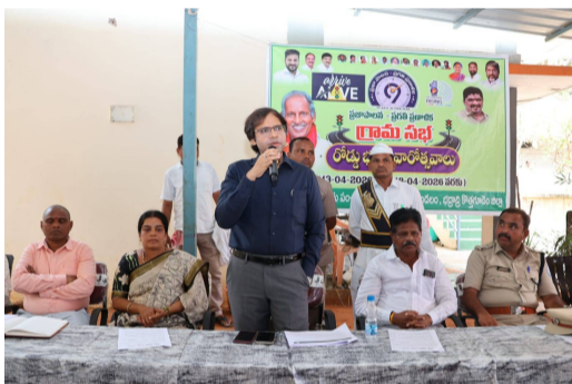
జిల్లా కలెక్టర్ అంకిత్.

భద్రాద్రి కొత్తగూడెం జిల్లా పెన్ సత్తా, ఏప్రిల్ 13: ప్రజాపాలన ప్రగతి ప్రణాళిక 99 రోజుల కార్యచరణ లో భాగంగా నిర్వహిస్తున్న రోడ్డు భద్రత వారోత్సవాల సందర్భంగా జిల్లా వ్యాప్తంగా రోడ్డు భద్రతపై అవగాహన కార్యక్రమాలు చేపడుతున్నట్లు జిల్లా కలెక్టర్ అంకిత్ తెలిపారు. ఈ కార్యక్రమాలలో భాగంగా సోమవారం చుంచపల్లి గ్రామపంచాయతీ కార్యాలయంలో నిర్వహించిన గ్రామసభకు కలెక్టర్ ముఖ్య అతిథిగా హాజరై ప్రసంగించారు. ఈ సందర్భంగా కలెక్టర్ మాట్లాడుతూ, మార్చి 6 నుండి ప్రారంభమైన ప్రజాపాలన ప్రగతి ప్రణాళిక 99 రోజుల కార్యక్రమంలో ప్రతి వారం వివిధ అంశాలపై ప్రత్యేక కార్యక్రమాలు నిర్వహిస్తున్నామని తెలిపారు. ఇందులో భాగంగా పారిశుధ్య కార్యక్రమాలు, హెల్త్ క్యాంపులు నిర్వహించడంతో పాటు డీ-ఆడిక్షన్ మరియు కౌన్సిలింగ్ సేవలను కూడా అందుబాటు లోకి తీసుకువచ్చామని చెప్పారు. జిల్లా వ్యాప్తంగా అన్ని గ్రామపంచాయతీలలో గ్రామ సభలు నిర్వహిస్తూ ప్రజలను ప్రత్యక్షంగా భాగస్వాములుగా చేసుకుంటూ అవగాహన కల్పిస్తున్నామని అన్నారు. రోడ్డు ప్రమాదాల పట్ల ప్రతి రోజూ అనేక మంది ప్రాణాలు కోల్పోతున్నారని ఆందోళన వ్యక్తం చేస్తూ, రోడ్డు ప్రమాదాలు