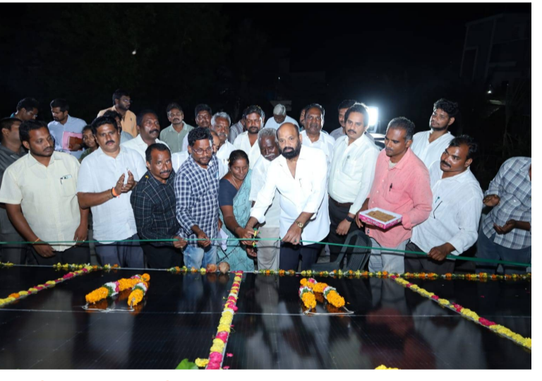
ఎస్సీ, ఎస్టీ కుటుంబాలకు పీఎం సూర్య ఘర్ పథకం ద్వారా ఉచిత సోలార్.