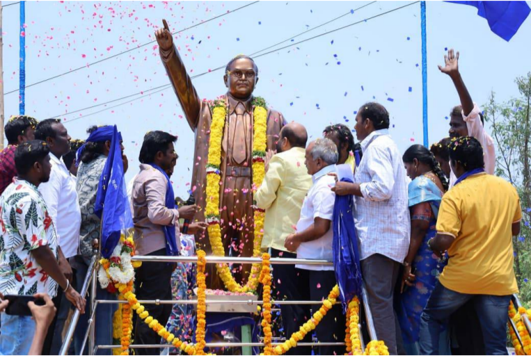
మహిళల హక్కుల కోసం మంత్రి పదవినీ త్యాగం చేసిన మహానీయుడు అంబేద్కర్ అంబేద్కర్ మహిళా హక్కుల పోరాట చరిత్రను పాఠ్యాంశాల్లో చేర్చాలని కోరుతూ.