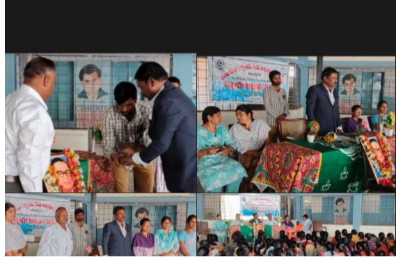
పలిగోండ మండలం పెన్ సత్తా, ఏప్రిల్ 14

న్యాయ వ్యవస్థ పై ప్రతి విద్యార్థిని విద్యార్థులు అవగాహన కలిగి ఉండాలి.