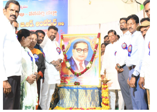
వనపల్లి జిల్లా పెన్ సత్తా, ఏప్రిల్ 14