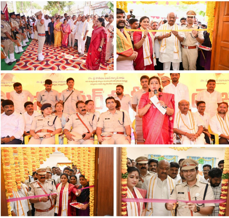
ప్రజా భద్రత ధ్యేయంగా ఆధునిక పోలీసింగ్.

నర్సపల్లం, పెన్ సత్తా, ఏప్రిల్ 14: అనకాపల్లి జిల్లా, నర్సపల్లం సబ్ డివిజన్ పరిధి లోని నాతవరం, కృష్ణదేవిపేట, గౌలుగోండ మండలాలలో నూతనంగా నిర్మించిన పోలీస్ స్టేషన్ భవనాలను ఆంధ్రప్రదేశ్ రాష్ట్ర శాసనసభ స్పీకర్ చింతకాయల అయ్యన్న పాత్రుడు