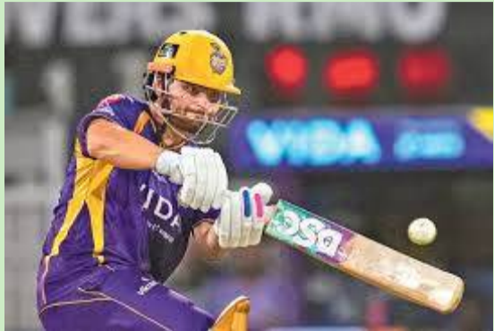
ఇది కోల్కతాకిది రెండో విజయం. ఎల్ఎస్జీకిది మొత్తంగా ఆరో ఓటమి.