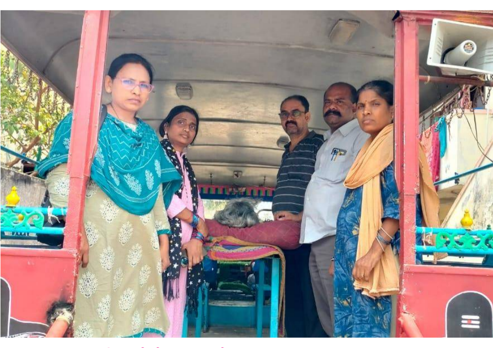
పెద్ద కొడుకులా అన్నీ తానే చేసిన సురక్ష సేవా సంఘం.. పాదె నుంచి చితి వరకు పూర్తి బాధ్యతతో దహన సంస్కారాలు..