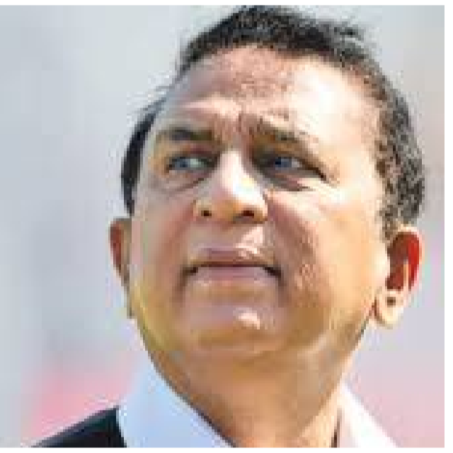
అదే ఆటగాళ్లు ప్రాంబ్లెజీలకు కావాలని గావస్కర్ చెప్పాడు.

ముంబయి: ఐపీఎల్లో తమ పాత్రను పూర్తిగా పోషించని విదేశీ ఆటగాళ్లపై చర్యలు తీసుకోవాలని మాజీ కెప్టెన్ సునీల్ గావస్కర్ డిమాండ్ చేశాడు. పనిభారాన్ని రృష్టిలో ఉంచుకుని కేకేఆర్ ఆల్ రౌండర్ కామరూన్ గ్రీన్ కేవలం బ్యాటింగ్కే పరిమితమవుతున్న నేపథ్యంలో అతను ఈ వ్యాఖ్యలు చేశాడు. “ఒక మ్యాచ్లో ఓ బౌలర్ వేసేది నాలుగు ఓవర్లే. మరి వాళ్లు అలా చేయకుండా అడ్డుకుంటున్నారేమిటి?” అని గావస్కర్ అన్నాడు. “ఒకవేళ ఆటగాడు ఫిట్గా లేకుంటే టోర్నికే ముందే వైద్యాలగలి. మరో ఆటగాళ్లు ఎంచుకునే అవకాశం ప్రాంబ్లెజీక్ ఇవ్వాలి” అని చెప్పాడు. “బీసీసీఐ రంగంలోకి దిగాలి. తొలి మ్యాచ్ నుంచే అందుబాటులో లేని ఆటగాళ్ల విషయంలో అమలు చేస్తున్న నిబంధనల లాంటివే.. ఫిట్నెస్ పేరుతో మ్యాచిలకు పూర్తిగా అందుబాటులో లేని ఆటగాళ్ల కోసం ప్రవేశపెట్టాలి” అని అన్నాడు. పూర్తి అంకితభావంతో