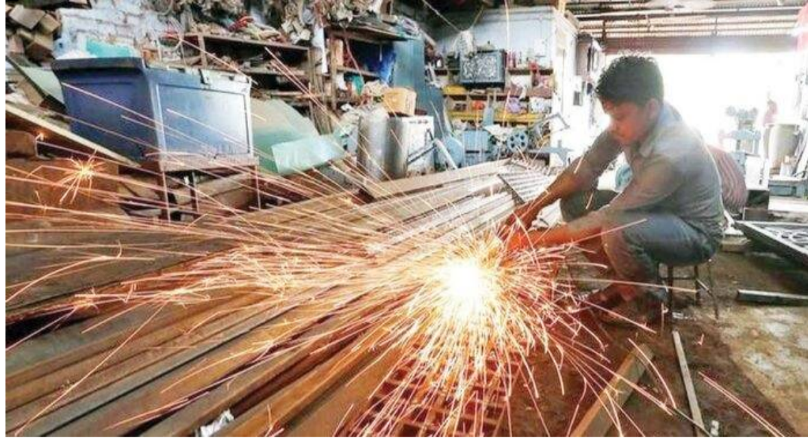
విషయాన్ని గుర్తు చేసింది. ప్రస్తుతం సరఫరా పరిమితులు హార్డువేర్ బ్యాంక్ తన నివేదికలో వెల్లడించింది. ఎగుమతుల్లో 15 శాతం వాటా ఉన్న గల్ఫ్ దేశాలకు జలసంధి దిగ్బంధం వల్ల ఎగుమతులు దెబ్బతినడం వంటి రవాణా నిలిచిపోవడం కూడా ఈ వృద్ధి కోతకు మరో ప్రధాన కారణమని తెలిపింది.

: ప్రస్తుత అంతర్జాతీయ ఉద్దేశ్యాల, ఇంధన వనరుల సరఫరాలో ఏర్పడిన అటంకాలతో భారత ఆర్థిక వృద్ధి తగ్గవచ్చని ఐసీఐసిఐ బ్యాంక్ ఓ రిపోర్ట్లో అంచనా వేసింది. ప్రస్తుత ఆర్థిక సంవత్సరం 2026-27లో భారత జీడిపీని గతంలో అంచనా వేసిన 7.2 శాతం నుంచి 6.8-6.9 శాతానికి తగ్గిస్తున్నట్లు పేర్కొంది. పశ్చిమాసియాలో యుద్ధం కారణంగా అంతర్జాతీయంగా చమురు ధరలు పెరగడం, సరఫరా గొలుసులో తలెత్తిన అవరోధాలు దేశీయ ఉత్పత్తిపై ప్రభావం చూపుతున్నాయని బ్యాంక్ ఆందోళన వ్యక్తం చేసింది. ముఖ్యంగా పారిశ్రామిక రంగానికి అవసరమైన ఇంధన సరఫరాపై ఈ నివేదిక ఆందోళన వ్యక్తం చేసింది. "పారిశ్రామిక ఇంధన సరఫరాపై ఆంక్షలు ఉన్నందున, గృహ అవసరాలకు ప్రాధాన్యత ఇస్తున్నారు. దీనివల్ల ఎరువులు, సిరామిక్స్, లోహాలు, గాజు వంటి రంగాల ఉత్పత్తి ప్రభావితమయ్యే అవకాశం ఉంది" అని ఐసీఐసిఐ బ్యాంక్ నివేదిక స్పష్టం చేసింది. గతంలో 2022లో ఇంధన ధరలు పెరిగిస్తున్నందు తయారీ రంగం ఏ విధంగా మందగించిందో గుర్తు చేసింది. ప్రస్తుతం మార్చి నెల తయారీ పీఎంబి 53.9కి పడిపోవడం తక్షణ ప్రభావానికి నిదర్శనమని పేర్కొంది. విదేశీ వాణిజ్యం, చమురు ధరల ప్రభావంపై ఐసీఐసిఐ బ్యాంక్ ఆందోళన వ్యక్తం చేసింది. చమురు ధరలు బ్యారెల్కు 100 డాలర్ల వద్ద కొనసాగడం వృద్ధికి ప్రతికూలమని తెలిపింది. చమురు ధరలు 111 డాలర్ల వద్ద ఉన్నప్పుడు (2012-14) నాస్తవ జీడిపీ 5.7 శాతానికి పడిపోయిన