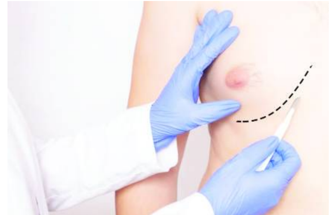
పంటి అదనపు లక్షణాలు పురుషుల్లో రొమ్ము క్యాన్సర్ కు సంకేతాలు. ఇలాంటి లక్షణాలు కనిపిస్తే వెంటనే వైద్య సాయం తీసుకోవాలి. పురుషుల్లో రొమ్ము క్యాన్సర్ ను గుర్తించేందుకు పూర్తిస్థాయి శారీరక పరీక్షలు, ఎక్స్ రే, బయోప్సీ, హిస్టోపాథాలజీ, హార్మోన్ రిసెప్టర్ పరీక్షలు నిర్వహిస్తారు.