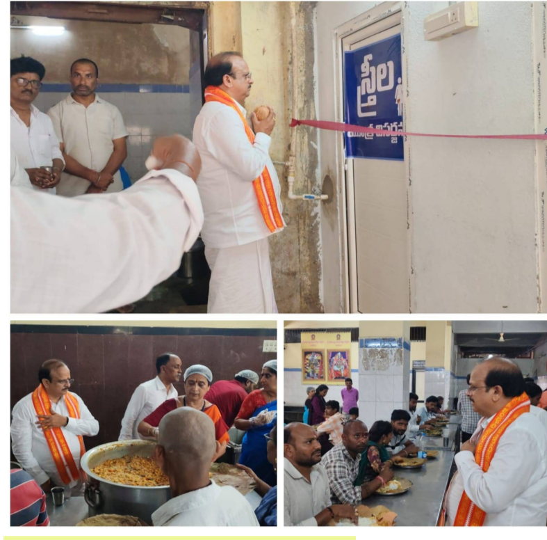
శ్రీతస్మాయిలో సమస్యలు గుర్తించి తక్షణ పరిష్కారం చూపిన ఈజి. జి.ఆర్.ఆర్. అన్నప్రసాద వద్ద భక్తులతో ముచ్చటించి, భోజననాణ్యతను పరిశీలించిన జి.ఆర్.ఆర్.

సింహచలం, పెన్ సత్తా, మే 30: సింహచలం వరాహ లక్ష్మి