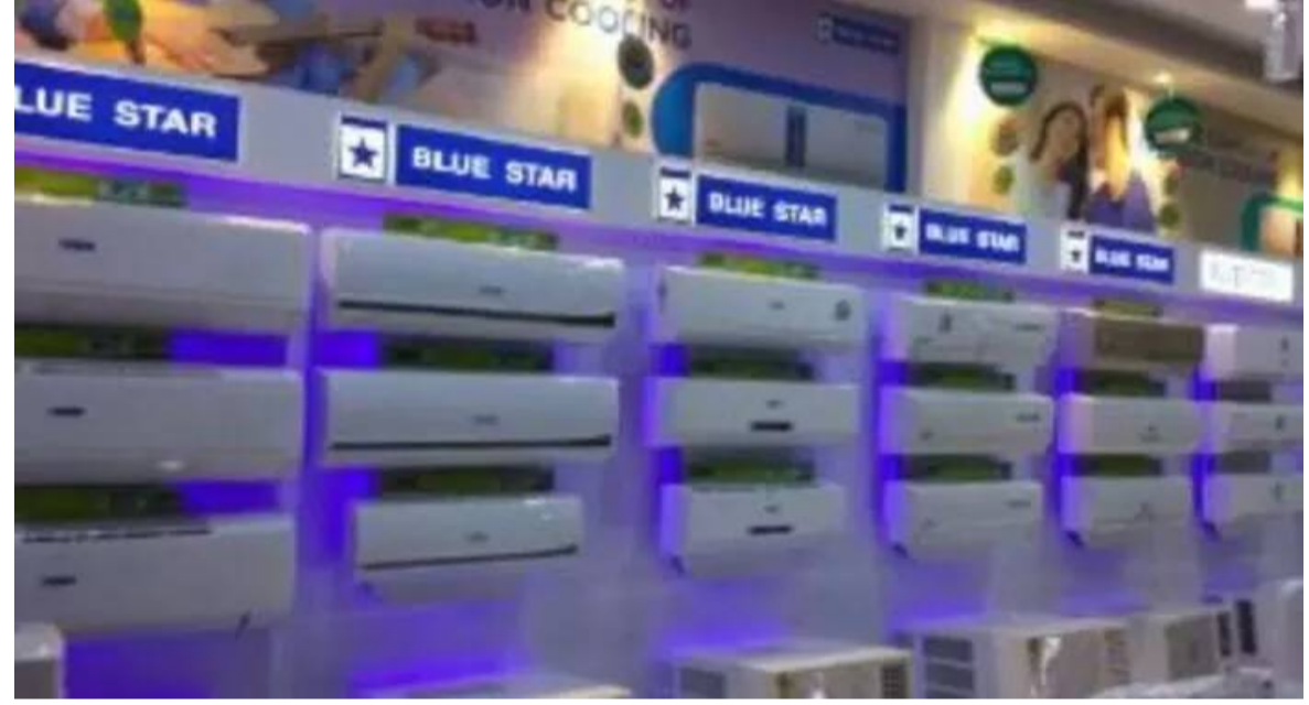
రాజ్ యే నెలల్లో ఏసీ ధరలు మరింత పెరిగే అవకాశం ఉందని ప్రముఖ ఎయిర్ కండీషనర్ల తయారీ సంస్థ బ్లూస్టార్ ఎండ్, కాన్వెడరేషన్ ఆఫ్ ఇండియన్ ఇండస్ట్రీ (సీఐఐ) వెబ్సైట్ రిజియన్ల చైర్మన్ వీర్ ఎస్

అధిని స్పష్టం చేశారు. రాగి, అల్యూమినియం, ఉక్కు వంటి కీలక ముడిసరుకుల ధరలు గణనీయంగా పెరగడం, అలాగే కొత్త ఇంధన సామర్థ్య నిబంధనలు అమలులోకి రావడం వల్ల తయారీ ఖర్చులు భారీగా పెరిగాయి. పరిశ్రమలో ధరలు ఇప్పటికే 14--16 శాతం వరకు పెరిగాయని, ఇది దాదాపు ఒక దశాబ్దం తర్వాత అత్యధిక పెరుగుదల అని ఆయన పేర్కొన్నారు. ఈ ఏడాది జనవరి నుంచి కొత్త ఎనర్జీ ఎఫిషియెన్సీ ప్రమాణాలు అమల్లోకి వచ్చాయి. వీటికి అనుగుణంగా తయారీని చేపట్టే క్రమంలో ధరల పెరుగుదలపై ప్రభావం చూపుతున్నాయి. గత కొద్ది నెలల్లో మార్కెట్లో ఉన్న ఉత్పత్తుల్లో చాలావరకు పాత ప్రమాణాలకు చెందినవే కావడంతో ధరల ప్రభావం పూర్తిగా వినియోగదారులకు బదిలీ కాలేదు. కానీ కొత్త ప్రమాణాల ప్రకారం తయారయ్యే ఉత్పత్తులు ఎక్కువ ఖర్చుతో ఉండటంతో, రానున్న రోజుల్లో ధరలు మరింత పెరగడం అనివార్యమని ఆయన స్పష్టం చేశారు.