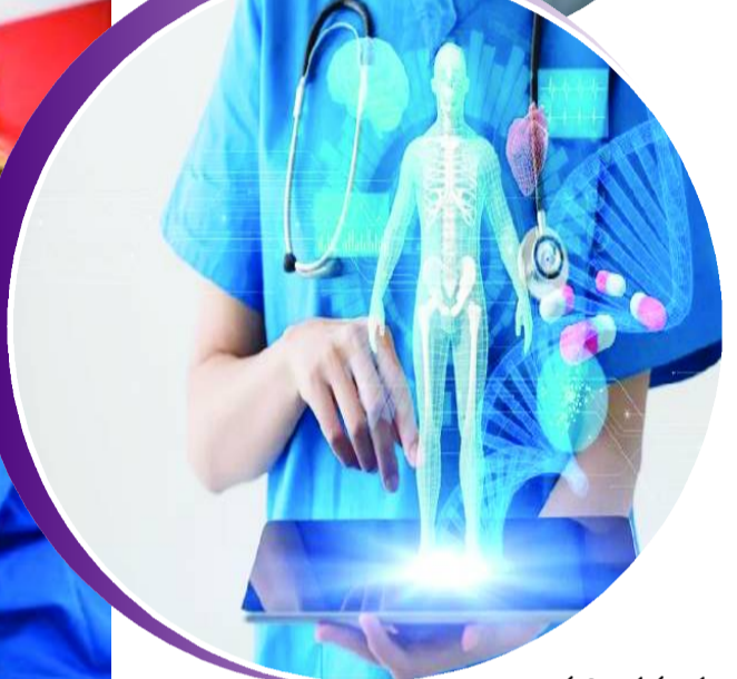
గుర్తించగలదు. దీంతో వాటి నివారణపై

మనిషి తన మేధస్సుతో (ఇంటెలిజెన్స్) నాటి నుంచి నేటి వరకు ఎంతో పురోగతి సాధించగా, ఇప్పుడు కృత్రిమ మేధ (ఆర్టిఫిషియల్ ఇంటెలిజెన్స్/ఏఐ) తీసుకొస్తుంది. ఎన్నో రంగాల్లో కృత్రిమ మేధ అనివార్యం కాగా, ముఖ్యంగా వైద్యం, ఆరోగ్య సంరక్షణ రంగాన్ని ఇది కొత్త పుంతలు తొక్కించనుంది. రోగుల సంక్షేమం, వ్యాధి నిర్ధారణ పరీక్షలు, చికిత్స ఇలా మొత్తంగా ఆరోగ్య నిర్వహణను వేగవంతం, సమర్థవంతంగా మార్చడమే కాదు, సులభతరం చేయనుంది. ఆరోగ్య సంరక్షణ, వైద్య సేవల్లో ఏట ఏ విధమైన మార్పులు తీసుకురానుందనే విషయాన్ని గమనించినట్లయితే..