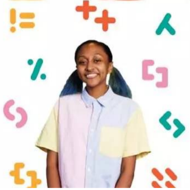
అనుబంధ విభాగాలు చదువుతున్న పేద విద్యార్థులకు రూ. 2 లక్షల ఆర్థిక సాయంతో పాటు చదువుకు అవసరమైన ల్యాప్టాప్లను కూడా అమెజాన్ సమకూరుస్తుంది. అమెజాన్

అమెజాన్ ఈ ప్రతిష్టాత్మక ప్రోగ్రామ్ కోసం 2022 నుండి ఇప్పటివరకు సుమారు రూ. 50 కోట్లు వెచ్చించింది. కేవలం ఇంజనీరింగ్ విద్యార్థులే కాకుండా, దేశవ్యాప్తంగా 50 వేలకు పైగా ప్రభుత్వ పాఠశాలల్లోని సుమారు 4.8 మిలియన్ల మంది విద్యార్థులకు కంప్యూటర్ సైన్స్ మరియు ఆర్టిఫిషియల్ ఇంటెలిజెన్స్ పై అవగాహన కల్పించడంలో ఈ వధకం కీలక పాత్ర పోషించింది. బీఈ/బీటెక్ లోని కంప్యూటర్ సైన్స్