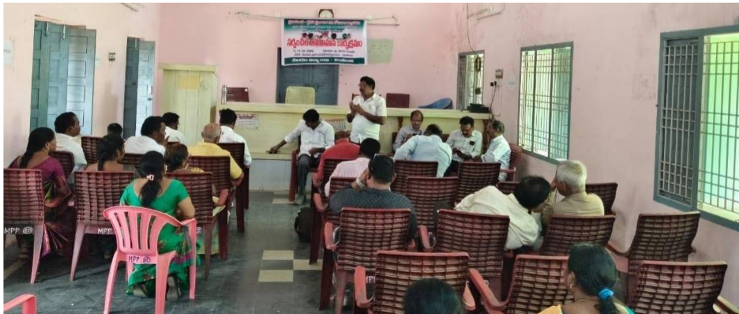
చింతకాని పెన్ సత్తా ప్రతినది మే 13, ప్రతినది : ప్రజా - 11/5/2026 నుండి 17/05/2026 వరకు జరిగే విద్యా పాలన ప్రగతి ప్రణాళికలో 99 రోజుల భాగంగా వారోత్సవాలలో భాగంగా 13/5/2026 చింతకాని మండల

విద్యా శాఖ అధికారి ఆధ్వర్యంలో గ్రామ సర్పంచ్ లకు అవగాహన కార్యక్రమం చేపట్టడం జరిగింది ఈ కార్యక్రమమునుకు వివిధ గ్రామపంచాయతీల సర్పంచులు హాజరైనారు గ్రామంలోని పాఠశాలల పట్ల గ్రామ సర్పంచులు గా వారి కర్తవ్యాలను విధులను వివరించి పాఠశాల ప్రధానోపాధ్యాయులకు తమ వంతుగా తగు సహాయ సహకారాలు అందించి, రాజీయే నూతన విద్యా సంవత్సరంలో ప్రభుత్వ పాఠశాలకు విద్యార్థులు ఎక్కువగా వచ్చేలా ప్రోత్సహించాలని, పాఠశాలల అభివృద్ధిలో భాగం కావాలని కోరడం జరిగింది, వివిధ గ్రామాల నుండి విచ్చేసిన సర్పంచులు వారు ఆయా గ్రామాలలో పాఠశాలకు చేస్తున్న అభివృద్ధి కార్యక్రమాల మరియు సహాయ కార్యక్రమాలను చేపట్టడంలో పనులు గురించి వివరిస్తూ పాఠశాలకు ఎల్లవేళలా అందుబాటులో ఉండే పాఠశాల అభివృద్ధికి తోడ్పడాలని ఈ సమావేశం లో తెలియజేయడం జరిగింది ఈ సమావేశం లో హై స్కూల్ ప్రధాన ఉపాధ్యాయులు పాల్గొన్నారు