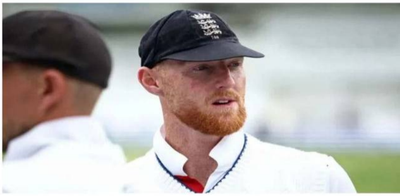
భవిష్యత్తు అశాశితం జేకేట్ డెబెల్ తో కలిసి సదరు బౌన్సర్ పై దాడి చేశాడు. అయితే దాడి పెద్దది కాకపోవడంతో ఈసీ బారిద్దరిని మందరింపుతో సరిపెట్టింది.

ఇంగ్లండ్ టెస్ట్ కెప్టెన్ బెన్ స్టోక్స్ భవిష్యత్తుపై సంచలన ప్రచారం జరుగుతోంది. తాజాగా న్యూజిలాండ్ పై లాస్ట్ టెస్టులో ఘన విజయం సాధించిన తర్వాత స్టోక్స్, సహచర ఆటగాడు గేస్ అట్కిన్సన్ జట్టు నిబంధనలను ఉల్లంఘించి అర్హరాతి కర్హ్య సమయంలో ఓ నైట్ క్లబ్లో ఉన్నట్లు ఆరోపణలు ఉన్నాయి. అక్కడ వారు పుల్లగా తాగి ఓ రగ్బీ ఆటగాడిపై దాడి చేసినట్లు నివేదికలు చెబుతున్నాయి. ఈ వివాదం తర్వాత స్టోక్స్ తన కెరీర్ కు ముగింపు పలకాలని నిర్ణయించుకున్నట్లు తెలుస్తోంది. 'ది క్రికెటర్' సీనియర్ జర్నలిస్ట్ జార్జ్ డోబెల్ ప్రకారం.. అతడు స్వచ్ఛందంగా కెప్టెన్సీ నుంచి తప్పుకోవడంతో పాటు రిటైర్మెంట్ కూడా ప్రకటించవచ్చు. అయితే దీనిపై అధికారిక ప్రకటన లేదు. ఇదిలా ఉంటే, నైట్ క్లబ్ ఫుటనలో స్టోక్స్, అట్కిన్సన్ ఎవరిపై దాడికి పాల్పడలేదని జుజుడి పర్గాలు చెబుతున్నాయి. అయినప్పటికీ కర్హ్య నిబంధనలు ఉల్లంఘించినందుకు వారిపై చర్యలు తప్పకపోవచ్చు. స్టోక్స్ ఇలాంటి సంఘటనలు కొత్తేమీ కాదు. గతంలోనూ పీకల దాకా తాగి రచ్చ చేసిన సంఘటనలు చాలా ఉన్నాయి. గతేడాది నవంబర్లో ఇంగ్లండ్ పరిమిత ఓవర్ల కెప్టెన్ హ్యరీ బ్రూక్ కూడా ఇలాగే నైట్ క్లబ్ వివాదంలో చిక్కుకున్నాడు. న్యూజిలాండ్తో వన్డే మ్యాచ్ ముందు వెల్లింగ్టన్లోని ఓ నైట్ క్లబ్ కు వెళ్లి బ్రూక్, అక్కడ బౌన్సర్ తో వాగ్వాదానికి దిగాడు. ఆ సమయంలో అక్కడే ఉన్న ఇంగ్లండ్