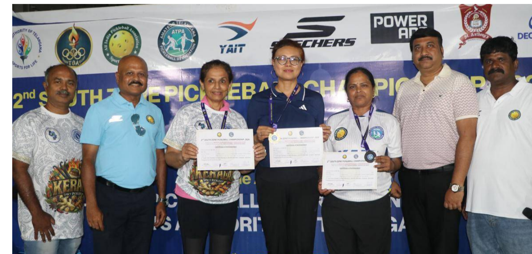
హార్షం వ్యక్తం చేశారు. క్రీడల పట్ల అంకితభావం, క్రమశిక్షణ, సందేశాన్ని ఆమె మరోసారి చాటిచెప్పారని వారు అభిప్రాయపడ్డారు.