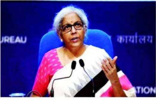
రాహుల్ భారత్ ఇబ్బందుల్లో ఉందనే భావనను ప్రజల్లో కల్పించడానికి ప్రయత్నిస్తున్నారు.

ప్రధాని నరేంద్ర మోదీని విమర్శించే క్రమంలో రాహుల్ గాంధీ, దేశ ప్రజలు సాధించిన విజయాలను తక్కువ చేసి మాట్లాడుతున్నారని కేంద్ర ఆర్థిక శాఖ మంత్రి నిర్మలా సీతారామన్ అన్నారు. దేశంలో ఎలాంటి సంక్షోభం లేకపోయినా, రాహుల్ గాంధీ ఊహాజనిత భయాలను సృష్టిస్తున్నారని ఆమె మండిపడ్డారు. లోక్సభలో మాట్లాడిన ప్రతిసారి దేశంలో అన్ని వ్యవస్థలూ కుప్పకూలిపోయినట్లు చిత్రీకరించే ప్రయత్నం చేస్తుంటారని విమర్శించారు. కరోనా, పశ్చిమాసియా సంక్షోభం వంటి సవాళ్లు ఎదురైనా భారత్ అద్భుతమైన ప్రగతిని సాధించిందని నిర్మలా తెలిపారు. అయినా రాహుల్ గాంధీ ఉద్దేశపూర్వకంగా వాటిని విస్మరిస్తున్నారని ఆరోపించారు. కేంద్రంలో ఎన్డీయే ప్రభుత్వం 12 ఏళ్ల పాలన పూర్తి చేసుకున్న సందర్భంగా ఆదివారం బెంగళూరులో నిర్వహించిన వికసిత భారత్ సంకల్ప సమావేశంలో పాల్గొన్న ఆమె రాహుల్ పై తీవ్ర విమర్శలు చేశారు. “లోక్సభలో కాంగ్రెస్ ప్రతిపక్ష నేత మాట్లాడిన ప్రతిసారి ప్రతీదానిని తప్పుపట్టడానికి ప్రయత్నిస్తున్నారు. ఆయన ప్రధాని మోదీని, కేంద్ర ప్రభుత్వాన్ని తక్కువ చేసి చూపిస్తున్నారని అనుకుంటున్నారు. కానీ వాస్తవానికి భారతదేశ ప్రజల విజయాలనే ఆయన తక్కువ చేసి చూపిస్తున్నారు. త్వరలో దేశంలో పెద్ద విపత్తు సంభవిస్తుందని రాహుల్ చెబుతున్నారు. కానీ అది అవాస్తవం. భారతదేశం అత్యంత వేగంగా వృద్ధి చెందుతున్న ఆర్థిక వ్యవస్థ అని మా ప్రభుత్వం మాత్రమే చెప్పడం లేదు. టీడీపీ గణాంకాలతోపాటు, అంతర్జాతీయ ప్రస్తుతి సంస్థ (ఐఎంఎఫ్) కూడా ఇదే విషయాన్ని స్పష్టం చేస్తోంది. పశ్చిమాసియా సంక్షోభం చమురు సరఫరాలో ఆస్పత్రవ నెలకొన్నా ప్రధాని మోదీ తీసుకున్న పూర్వోత్కృత నిర్ణయాలతో దేశంలో ఇంధన సరఫరాకూ అంతకాలం ఏర్పడలేదు. కానీ