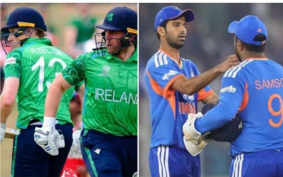
మూడో, ఐదో టీ20లు) మ్యాచ్లను రాత్రి 10 గంటలకు నిర్వహించనున్నారు. ఇక ఆగస్టులో మొదలయ్యే శ్రీలంక పర్యటన విషయంలోనూ బీసీసీఐ కీలక నిర్ణయం తీసుకుంది.

భారత్, ఐర్లాండ్ టీ20 సిరీస్ షెడ్యూల్ మారింది. ఇది వరకు ప్రకటించిన సమయానికంటే గంట ముందే మ్యాచ్లు జరుగుతున్నాయి. మహిళల టీ20 వరల్డ్ కప్ మ్యాచ్ల నేపథ్యంలో ఐర్లాండ్ క్రికెట్ ఈ నిర్ణయం తీసుకుంది. భారత్, తమ జట్టు మధ్య జరుగుతున్న రెండు టీ20ల సమయాన్ని మార్చినట్లు బుధవారం రాత్రి ఆ దేశ బోర్డు వెల్లడించింది. ఐర్లాండ్ పర్యటనలో శ్రేయాన్ అయ్యర్ సారథ్యంలోని భారత పురుషుల జట్టు రెండు టీ20ల సిరీస్ ఆడనుంది. భారత కాలమానం ప్రకారం రాత్రి 7 గంటలకు మ్యాచ్లు జరగాల్సి ఉంది. జూన్ 26న తొలి టీ20.. ఆపై ప్రపంచకప్లో సెమీస్ టెస్టుపై కన్నేసిన టీమిండియా జూన్ 28న ఆస్ట్రేలియాను ఢీ కొట్టనుంది. ఉంది. లాస్ట్ మైదానంలో ఈ మ్యాచ్ రాత్రి 7 గంటలకు జరుగుతుంది. దాంతో, రెండూ ఒకేసారి మొదలవ్వకూడదనే ఉద్దేశంతో.. ఆరోజు భారత్, ఐర్లాండ్ గేమ్ను గంట ముందు అంటే.. సాయంత్రం 6 గంటలకు నిర్వహించేందుకు ఐర్లాండ్ క్రికెట్, బీసీసీఐ అంగీకరించాయి. టీమిండియా మ్యాచ్లను ప్రసారం చేసే సోసీ సెన్సార్స్ సైతం షెడ్యూల్ మార్పును ఆమోదం తెలిపింది. అలానే.. ఇంగ్లండ్ పర్యటనలోనూ భారత జట్టు ఐదు టీ20ల సిరీస్లో మ్యాచ్ల సమయం కూడా తేడాగా ఉంది. రెండు, నాలుగో టీ20లు రాత్రి 7 గంటలకు జరుగుతుండగా.. మిగతా మూడు ఒకటో,