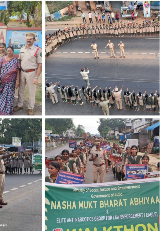
వెంటనే పోలీసులకు సమాచారం అందించి, మాదకద్రవ్యాల రహిత సమాజం నిర్మాణానికి ప్రతి ఒక్కరూ సహకరించాలని కోరారు.