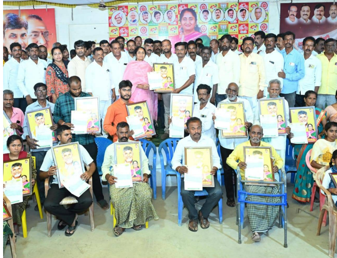
అధికారులు, పార్టీ నాయకులు, కార్యకర్తలు, లబ్ధిదారులు మరియు వారి కుటుంబ సభ్యులు పాల్గొన్నారు.