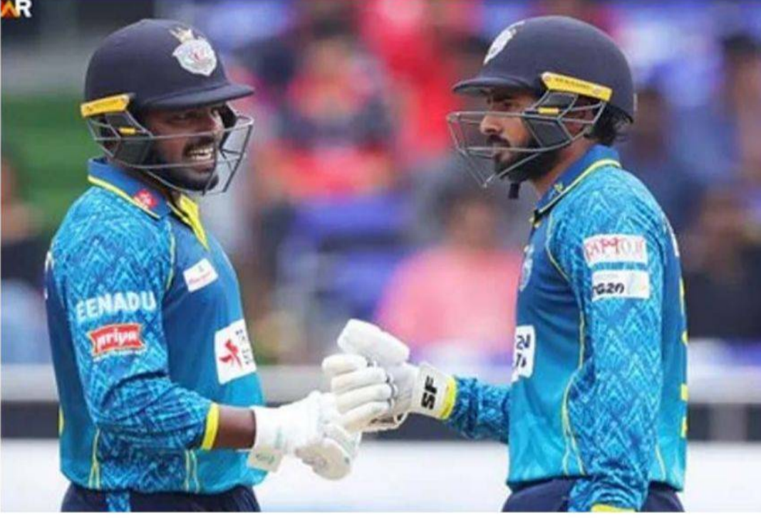
హైదరాబాద్ రన్ రేట్ను భారీగా మెరుగుపర్చుకొని పాయింట్ల పట్టికలో సోలోగా అగ్రస్థానంలో నిలిచింది.