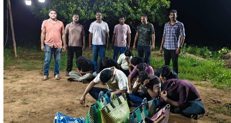
తొమ్మిది మంది అరెస్ట్, రూ.28,070 నగదు స్వాధీనం.