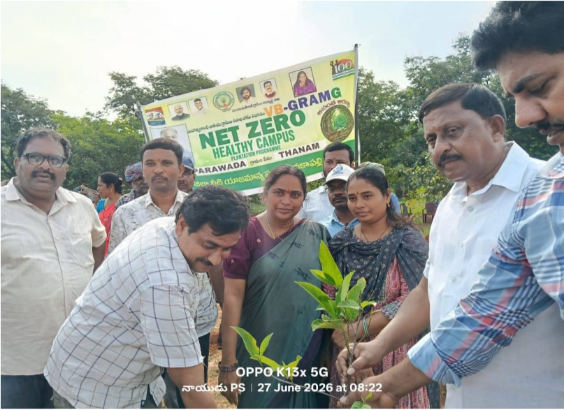
OPPO K13x 5G నాయుడు PS 27 June 2026 at 08:22

పరవడ, పెన్ సత్తా, జూన్ 27: కూటమి ప్రభుత్వం చేపట్టిన అనంత అరణ్యం కార్యక్రమంలో భాగంగా తాణాం గ్రామంలో మహాత్మా జ్యోతిరావు పూలే ప్రభుత్వ జూనియర్ కళాశాల, పాఠశాల ఆవరణలో, నెట్ జీరో హెల్త్ క్యాంపస్ ఫ్రాంట్‌వర్క్ ప్రోగ్రాంలో మొక్కలు నాటడం జరిగినది. శనివారం ఈ కార్యక్రమంలో మొక్కలు నాటడం