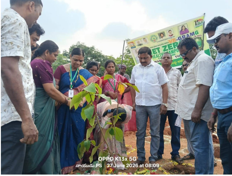
OPPO K13x 5G నాయుడు PS 27 June 2026 at 08:09

పరవడ, పెన్ సత్తా, జూన్ 27: కూటమి ప్రభుత్వం చేపట్టిన అనంత అరణ్యం కార్యక్రమంలో భాగంగా తాణాం గ్రామంలో మహాత్మా జ్యోతిరావు పూలే ప్రభుత్వ జూనియర్ కళాశాల, పాఠశాల ఆవరణలో, నెట్ జీరో హెల్త్ క్యాంపస్ ఫ్రాంట్‌వర్క్ ప్రోగ్రాంలో మొక్కలు నాటడం జరిగినది. శనివారం ఈ కార్యక్రమంలో మొక్కలు నాటడం