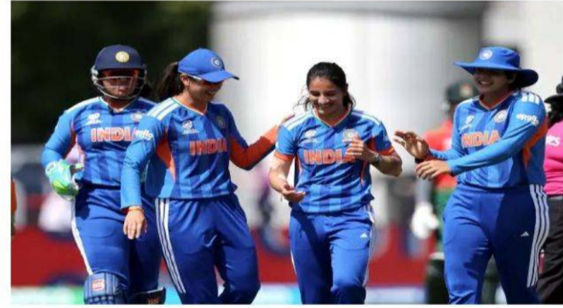
ఒలింపిక్స్లో క్రికెట్ పోటీలను ఆరు జట్లతో నిర్వహించనున్నారు.

ఇంటర్నేట్ డెస్క్: టీ20 ప్రపంచ కప్ 2026లో గ్రూప్ దశలోనే బోర్ని సుంచి నిష్క్రమించి బాధలో ఉన్న భారత మహిళల క్రికెట్ జట్టుకు గుడ్ న్యూస్. 2028 ఒలింపిక్స్కు హర్షదేవ్ సేన అర్జున్ సాధించింది. ఈ మేరకు ఐసీసీ, అంతర్జాతీయ ఒలింపిక్ కమిటీ (ఐఓసీ) ప్రకటించాయి. ప్రస్తుతం జరుగుతున్న మహిళల టీ20 ప్రపంచ కప్లో టీమ్ ఇండియా సెమీ ఫైనల్స్కు చేరుకోలేకపోయింది. అయితే, ఈ బోర్నిలో ఆసియా తరఫున భారత్ అత్యుత్తమ ప్రదర్శన చేసింది. దీంతో భారత జట్టు ఒలింపిక్ టెస్టును ఖాయం చేసుకుంది. ఆస్ట్రేలియా, ఇంగ్లాండ్, సౌతాఫ్రికా కూడా క్వాలిఫై అయ్యాయి. ఆమెరికాలోని లాస్ ఏంజెలెస్ వేదికగా 2028 ఒలింపిక్ గేమ్స్ జరగనున్నాయి. 1900లో ఒక్కసారి మాత్రమే ఒలింపిక్స్లో భాగమైన క్రికెట్.. 2028లో పునరాగమనం చేయబోతున్న సంగతి తెలిసిందే. లాస్ ఏంజెలెస్