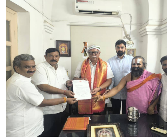
విజయనగరం, పెన్ సత్తా, జూన్ 29: విశాఖపట్నం ఉత్తర నియోజకవర్గం లోని కప్పూరు ఎన్టీజీసీ కాలనీ, 49 వ