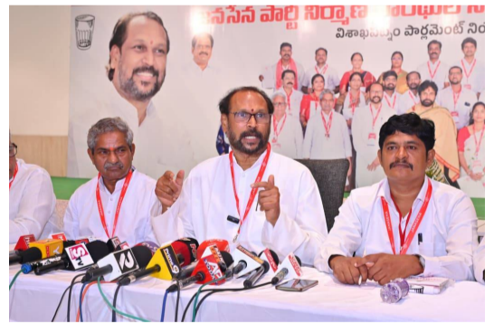
చుట్టారన్నారు. నైపుణ్యం ఉన్న నాయకులను తయారు చేయాలనే ఉద్దేశంతో నూతన విధానంతో ముందుకు వెళ్తున్నారు.