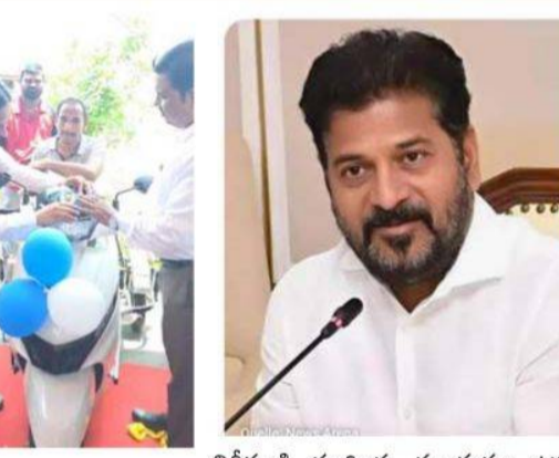
నిరీక్షణికి ముగింపు పలుకుతూ ఉన్న చోటనే / అతి దగ్గరలో పడేస్తున్న పొందేలా ౬ 70 శాతం పైన దివ్యాంగులకు ఉన్న దివ్యాంగులకు బదిలీలు లేకుండా జి.ఓ. నం. 34 అమలు చేయడం - ప్రపంచ వికలాంగుల దినోత్సవం రోజున సా. ఐ. సౌకర్యం కల్పించేలా +౫. - సంవత్సరాల తరబడి పెండింగ్ లో ఉన్న దివ్యాంగులను సకలాంగులు పెండిట్ చేసుకున్నప్పుడు ఇచ్చే ప్రోత్సాహం అందజేత - 1981నుండి ఎన్నడూ లేని విధంగా దివ్యాంగుల కార్పొరేషన్ లో నెలలో 1వ బుధవారం ౬ 3వ బుధవారం ప్రత్యేక గ్రీవెన్స్ దివ్యాంగుల కొరకు నిర్వహిస్తూ సమస్యల పరిష్కారానికి కృషి - పాఠా స్కాల్స్ అనేసియేషన్ ఆఫ్ తెలంగాణ ఆధ్వర్యంలో జీవన్ జి దిప్తి (పాఠా ఓపింగ్ డ్రాజింగ్ )కి సాహస సహకారం తో 1 కోటి రూపాయల నగదు, గ్రూప్ 2 ఉద్యోగం, 500 గజాలు స్థలం ఇప్పించడం, స్కాల్స్ పాలన ఏర్పాటు రాష్ట్రంలోని దివ్యాంగుల సంక్షేమం దిశగా రాష్ట్ర ప్రభుత్వం రాష్ట్ర మంత్రివర్గం, అధికార యంత్రాంగం, స్వచ్ఛంద సంస్థల సహాయంతో అనేక పథకాలు అమలు చేస్తూ దివ్యాంగుల అభివృద్ధికి కృషి చేస్తుందని తెలిపారు.

- దేశంలో ఎక్కడా లేని విధంగా దివ్యాంగులకు 40 శాతం వైకల్యానికి ట్రై మోటార్ల జిల్లా సూటిలతో పాటు బ్యాటరీ ట్రై సైకిళ్లు, ఇన్వేంటీవ్ బ్యాటరీవీల్ చైర్లు,బ్యాటరీ వీల్ చైర్లు, బిసినెస్ ఎంపర్ల కాస్ట్, బిసినెస్ ఎంపర్ల , అంద విద్యార్థుల కొరకు హై ఎండ్, లో ఎండ్ ల్యాప్ టాప్ లు, బ్యాట్లీ లు, ఉన్నత విద్య అభ్యసించే సౌకర్య దివ్యాంగులకు అమలు చేయడం, బిరుదుల కోసం 5+ స్మార్ట్ ఫోన్లు, వినీకిడి యంత్రాలు, చేతి కర్రలు, సంచక కర్రల పంపిణీ కొరకు ప్రత్యేక శిబిరాలు - సహాయ ఉపకరణాలకు సంబంధించి గత ప్రభుత్వంలో ఉన్న నిబంధనలు 20కి పైగా తొలగించి సులభతరం - రాష్ట్ర వ్యాప్తంగా 1000 మందికి పైగా కిరాణి షాప్ నడుపుకునే వారు, టైలరింగ్ చేసే వారు, ఫోటో గ్రాఫర్ గా జలా అనేక వృత్తులు చేసుకునే వారు లబ్ధి పొందారు - మహిళ సంక్షేమ శాఖ కార్యదర్శి వాకాటి కరుణ సహాయంతో శాఖ ప్రధాన కార్యాలయంలో 16 మంది దివ్యాంగ అమ్మాయిలకు ఉపాధి - రాష్ట్ర వ్యాప్తంగా ఇప్పటి వరకు దాదాపు 80 మందికి పైగా ఔట్ సోర్సింగ్ విధానంలో కనీస భృతి లేక ఇబ్బంది పడుతున్న వారికి ఉద్యోగాలు - 6 నం.ల లోపు వయస్సు ఉన్న దివ్యాంగులకు శిల్ప చికిత్సలు చేసి సాధారణ వ్యక్తులుగా మార్చడం కోసం బాల భరోసా కార్యక్రమం - పోలీస్ అడ్వైన్స్ డివిజన్ ౬ టెక్నికల్ ఉద్యోగాలలో దివ్యాంగులకు ప్రత్యేక రిజర్వేషన్ - ఇందిరమ్మ ఇండ్లలో 5 శాతం రిజర్వేషన్ ద్వారా వేల మంది దివ్యాంగులకు సొంత నివాసం - రాజీవ్ యువ వికాసంలో రాష్ట్ర ఉప ముఖ్యమంత్రితో మాట్లాడి షెడ్యూల్డ్ కులాల కార్పొరేషన్ లో షెడ్యూల్డ్ కులాల దివ్యాంగులు, షెడ్యూల్డ్ తెగల కార్పొరేషన్ లో షెడ్యూల్డ్ తెగల దివ్యాంగులకు 5% శాతం రిజర్వేషన్ - వికలాంగుల ఉద్యోగాలు రెండు దశల్లోగా చేస్తున్న