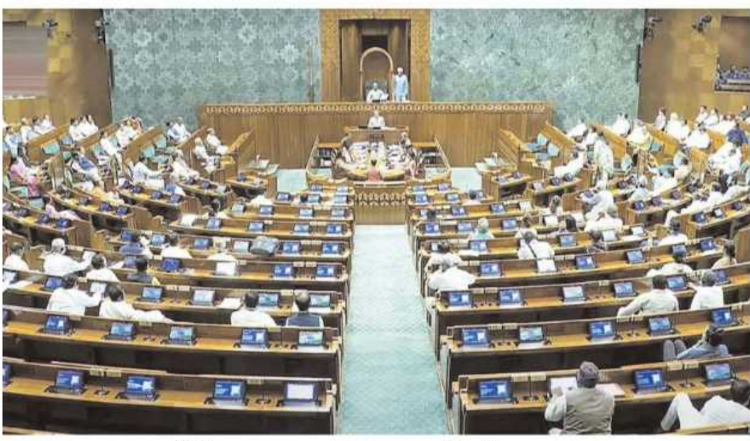
కారణంగా ఆగస్టు 13, 14 తేదీల్లో సభకు సెలవు ఉంటుంది. ఈ సమావేశాల్లోనే చర్చకు రానున్నాయి. 130వ రాజ్యాంగ సవరణ బిల్లుతో పాటు పలు కీలక బిల్లులు

ఢిల్లీ: రాజీయే పార్లమెంట్ వర్గాల సమావేశాల్లో కేంద్ర ప్రభుత్వం ఒక కీలక బిల్లును తీసుకురానుంది. అదే 130వ రాజ్యాంగ సవరణ బిల్లు. ఈ కొత్త చట్టం ప్రకారం.. ఏదైనా తీర్మానం క్రిమినల్ లేదా అవినీతి కేసులో అరెస్టును, వరుసగా 30 రోజులకు మించి జైల్లో ఉంటే సదరు ప్రజాప్రతినిధి తన పదవిని కోల్పోతారు. రాజకీయాల్లో అవినీతిని అరికట్టేందుకు తెస్తున్న ఈ చట్టం.. దేశ ప్రధాని, ముఖ్యమంత్రులు, మంత్రులతో పాటు ఎంపీలు, ఎమ్మెల్యేలందరికీ వర్తిస్తుంది. ఈ బిల్లును పరిశీలిస్తున్న సంయుక్త పార్లమెంటరీ కమిటీ ఈ సమావేశాల ప్రారంభంలోనే తన నివేదికను సభకు సమర్పించనుంది. జేపీసీ నివేదికను పరిశీలించిన తర్వాత, ఈ బిల్లును ఆమోదం కోసం ప్రభుత్వం పార్లమెంట్ ముందుకు తెస్తుంది. రాజ్యాంగ సవరణ బిల్లు కావడంతో, జది చట్టంగా మారాలంటే పార్లమెంట్ లోని ఉభయ సభల్లో మూడింట రెండు వంతుల మెజారిటీ అవసరం అవుతుంది పార్లమెంట్ వర్గాల సమావేశాలు జూలై 21 నుంచి ప్రారంభమై ఆగస్టు 21 వరకు జరగనున్నాయి. కేంద్ర పార్లమెంటరీ వ్యవహారాల మంత్రి వెల్లడించిన వివరాల ప్రకారం.. ఈ సమావేశాలకు సంబంధించిన ప్రతిపాదనకు రాష్ట్రపతి ద్రౌపది ముర్ము ఆమోదం తెలిపారు. స్వాతంత్ర్య దినోత్సవ వేడుకల