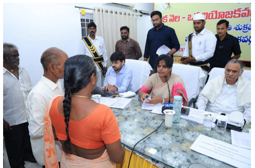
గ్రీవెన్స్ దరఖాస్తులు త్వరితగతిన పరిష్కరించాలి. క్షేత్ర స్థాయిలో సమస్యలు పరిష్కరించ కుంటే సంబంధిత అధికారుల పై చర్యలు తప్పవు. జిల్లా కలెక్టర్ విజయ క్రిష్ణన్.