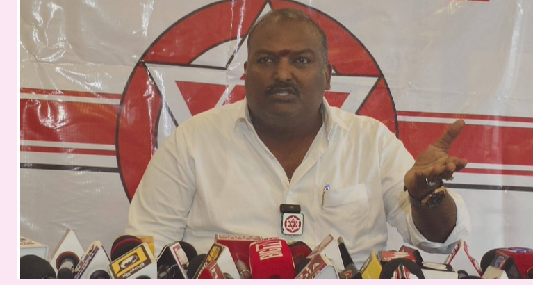
వైసీపీ కుట్రలను ప్రజలు గమనించాలి.