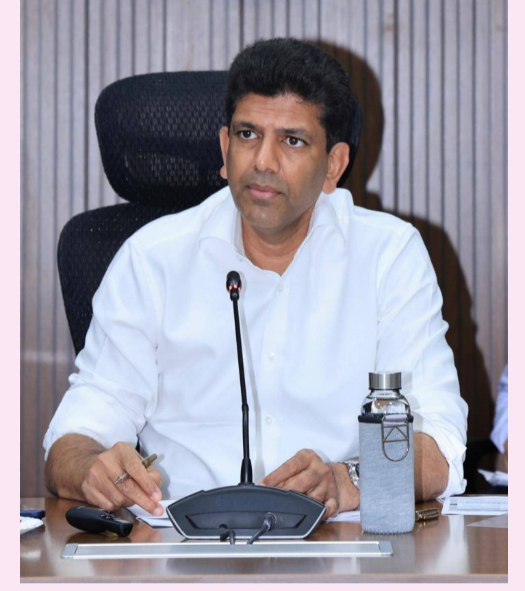
నిషేధిత జాబితా నుంచి తొలగిస్తూ కలెక్టర్ ఉత్తర్వులు.